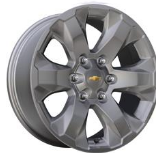
RPO 5PC 18" aluminio