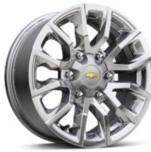
RPO RZ0 16" aluminio