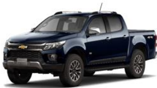
Azul Lunar Metálico (G5K)