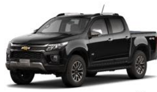
Negro Grafito Metálico (GB8)