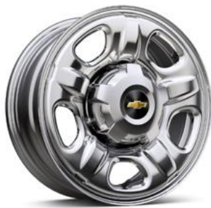
RPO RRY 16" acero