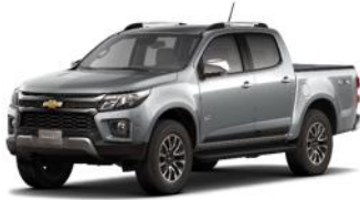
Plata brillante (GAN)