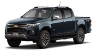
Gris Granito Metálico (GOE)