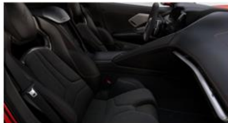
Jet Black (HTT) Default “costuras rojas” (38S)