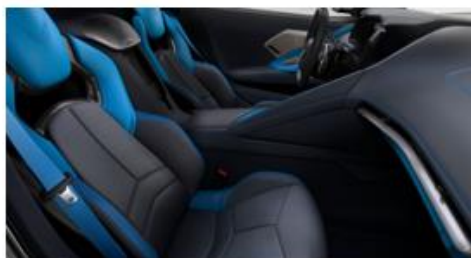
Twilight blue / Tension Blue (HTO)