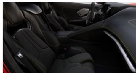
Jet Black (HTT)/Alternativa “costuras amarillas” (36S)

*Las costuras deben elegirse en el formato de personalización, de no hacerlo se tomará la configuración: Default “costuras rojas”