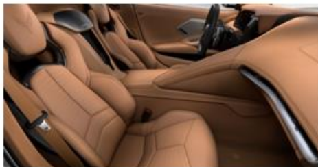
Natural Dipped (HZN)