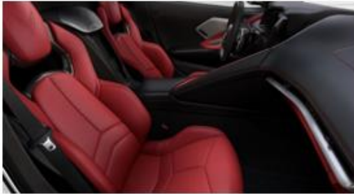
Opción A: Jet Black / Adrenaline Red (HU2)