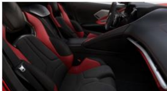
Jet Black / Adrenaline Red (HUA)