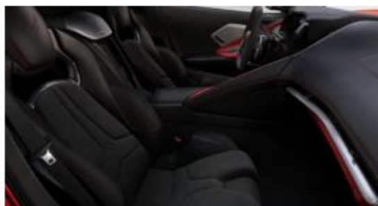
Jet Black / Adrenaline Red (HZP)