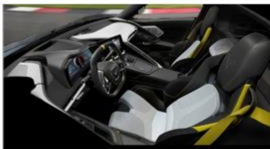
Sky Cool Gray / Strike Yellow (HFC)