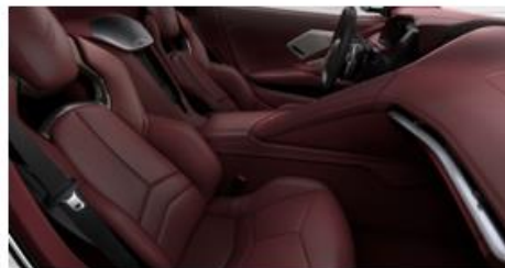
Morello Red Dipped (HU3)