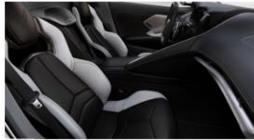
Opción B: Jet Black / Sky Cool Gray (TU7)