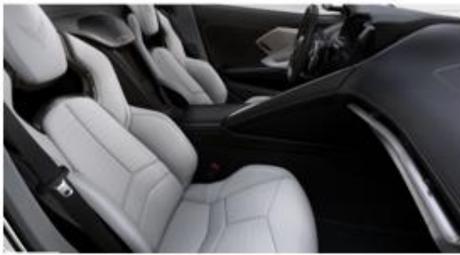
Opción A: Jet Black / Sky Cool Gray (HU1)