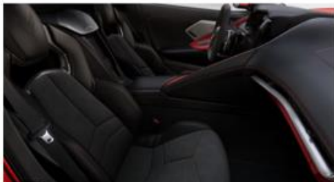
Jet Black / Adrenaline Red Variation 1 Insertos en Gamuza (HUU)

*La opción TU7 de todos los colores debe especificarse en el formato de personalización