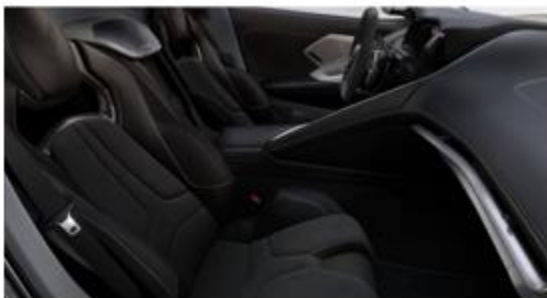
Jet Black / Sky Cool Gray (HU9)