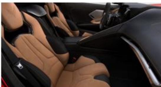
Jet Black / Natural (HTG)