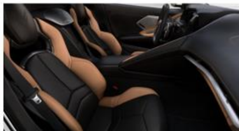
Opción B: Jet Black / Natural (TU7)