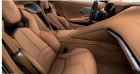
Natural Dipped (HUF)