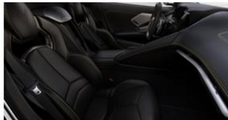
Jet Black (HTE)/Alternativa "costuras amarillas" (36S)

*Las costuras deben elegirse en el formato de personalización, de no hacerlo se tomará la configuración: Default "costuras rojas"