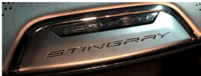
Placa estándar NO personalizada