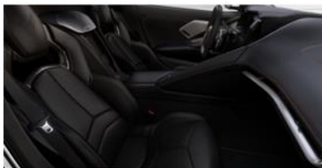
Jet Black (HTE)/Default "costuras rojas" (38S)