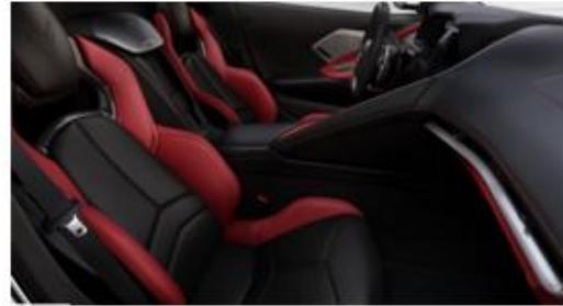
Opción B: Jet Black / Adrenaline Red (TU7)

*La opción TU7 de todos los colores debe especificarse en el formato de personalización