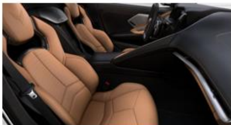
Opción A: Jet Black / Natural (HUE)