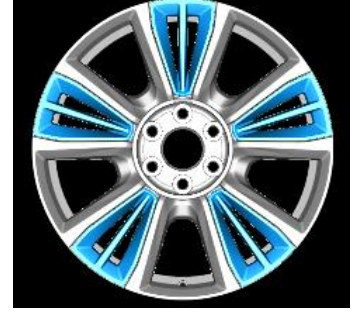
RPT (HIGH COUNTRY)