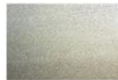
Arena metálico (58U)