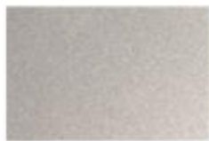
Plata metálico (12U)